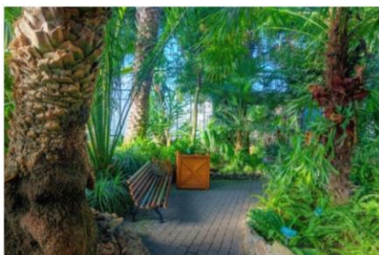
Palmový dům – interiér

V současné době roste v Palmovém domě více než 250 druhů rostlin, které představují flóru různých klimatických zón a různých kontinentů. Zvláštní pozornost zde přitahují obří palmy a pestrá sbírka kaktusů.