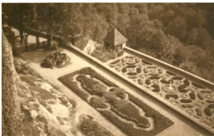
Zámecké terasy - 20. léta XX. století

Vznik současného parkového komplexu souvisí s nejvýznamnější barokní přestavbou hradu v 18. století v době Konrada Ernsta Maxmiliána. Tehdy byly vytvořeny historické parkové uličky, prvky parkové architektury, dvůr a vstupní nádvoří. Zámek se změnil na barokní palác a získal si pozici jednoho z nejkrásnějších dolnoslezských sídel. Jedním z hlavních prvků hradní architektury bylo tzv. letní sídlo postavené v roce 1734 na Topolové hoře, které představovalo ústřední bod zahrady, ke které vedly radiálně vytyčené lipové třídy. Letní pavilon na konci 19. století změnil svou funkci a byl přestavěn na hrobovou kapli posledních majitelů hradu – rodiny Hochbergů, kteří vládli hradu po více než čtyři století.