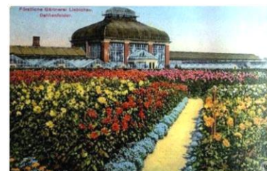
Přístup do hlavní budovy Palmového domu – předválečná pohlednice

Tato investice spotřebovala astronomickou částku 7 milionů zlatých marek. Na ploše 1 900 metrů čtverečních byly postaveny kromě Palmového domu také skleníky, zahrady v japonském stylu, rozárium, ovocná a zeleninová zahrada a prostor pro pěstování keřů. Celý záměr dostal jméno zahradnického centra. Bezprostředně po dokončení stavebních prací bylo do Lubiechowa přivezeno přibližně 80 druhů nových rostlin. Ústřední částí budovy byla budova s délkou 15 metrů, zbudovaná z kovu a skla, do které byly vysazeny datlové palmy. Celek byl potom obklopen jednopatrovými oranžeriami a na střeše Palmového domu byla vytvořena malá vyhlídková galerie poskytující výhled do okolí. Nejneobvyklejším však byl stavební materiál, který byl použit v interiéru Palmového domu. Kníže totiž nechal dovézt sedm vagonů sopečného materiálu ze sicilské sopky Etna. Stavitelé pak sopečný tuf