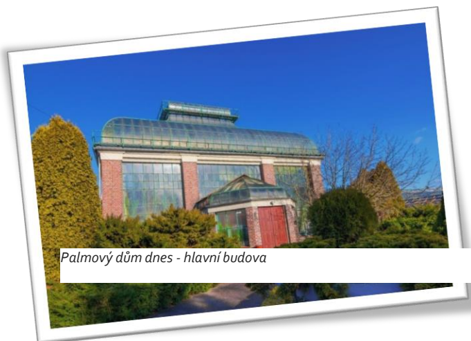
Palmový dům dnes - hlavní budova

Tato investice spotřebovala astronomickou částku 7 milionů zlatých marek. Na ploše 1 900 metrů čtverečních byly postaveny kromě Palmového domu také skleníky, zahrady v japonském stylu, rozárium, ovocná a zeleninová zahrada a prostor pro pěstování keřů. Celý záměr dostal jméno zahradnického centra. Bezprostředně po dokončení stavebních prací bylo do Lubiechowa přivezeno přibližně 80 druhů nových rostlin. Ústřední částí budovy byla budova s délkou 15 metrů, zbudovaná z kovu a skla, do které byly vysazeny datlové palmy. Celek byl potom obklopen jednopatrovými oranžeriami a na střeše Palmového domu byla vytvořena malá vyhlídková galerie poskytující výhled do okolí. Nejneobvyklejším však byl stavební materiál, který byl použit v interiéru Palmového domu. Kníže totiž nechal dovézt sedm vagonů sopečného materiálu ze sicilské sopky Etna. Stavitelé pak sopečný tuf