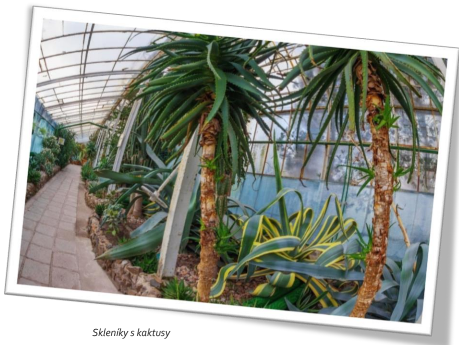
Skleník s kaktusy

Investice realizované Hochbergy začátkem 20. století – vč. rozšíření hradu a stavby Palmového domu přivedly rodinu do velkých dluhů. Od roku 1940, kdy nacistické úřady převzaly zámek a jeho okolí, se stav vybavení, výzdoby samotného hradu, vegetace teras a parku včetně Palmového domu začal zhoršovat. Samotný hrad přišel o většinu vybavení a stal se velkým stavenišťem. Książ převzala polovojenská organizace Todt, která pomocí vězňů přivezených z tábora Gross Rosen,