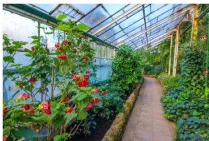
Skleník Palmového domu – interiér

Palmový dům se vrátil na hrad v roce 2012, kdy také začali velké renovační práce, včetně těch, které jsou předmětem projektu s názvem „Z tropů do tropů v česko-polském pomezí“ realizovaného v rámci programu Interreg V-A Česká republika – Polsko.