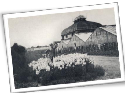
Zaměstnanci hradu před budovou Palmového domu