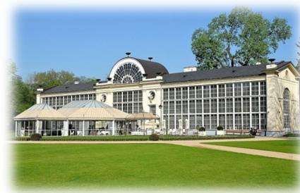
Palmiarnia w Łazienkach Królewskich w Warszawie

Główną część budynku stanowi wydłużona sala, która jest przeszklona od strony południowej, która przeznaczona była pierwotnie na przechowywanie w okresie chłódów drzew egzotycznych. Obecnie został tu urządzony stały ogród z różnorodnymi roślinami, również tropikalnymi. Pomieszczenia od strony północnej zostały przeznaczone na urządzenie stylowej restauracji „Belvedere”, swym wystrojem nawiązującej do lat wzniesienia budynku.