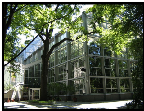
Palmiarnia w Łodzi

Kolejna modernizacja i podwyższenie dachu miało miejsce w 1970 roku, ponieważ rosnące rośliny napierały na dach. Została też przeszklona górna kondygnacja.