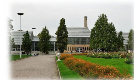
Palmiarnia Poznańska

wybuch bomby lotniczej podczas alianckiego nalotu w 1941 roku spowodował, że w szklarni wypadły szyby i podczas zimy 1941/1942 wiele eksponatów zginęło. Połamane zostały drzewa i krzewy, a 30% najcenniejszych gatunków roślin poważnie. Podczas walk w 1945 palmiarnia została zniszczona w 90%, jednak już w tym samym roku przystąpiono do odbudowy. Dzięki uratowaniu części zbiorów, a także roślinom zwiezionym z terenu całego kraju już w 20 kwietnia 1946 otwarto niemal wszystkie pawilony. Palmiarnia otrzymała też liczne dary z innych instytucji i miejscowości.