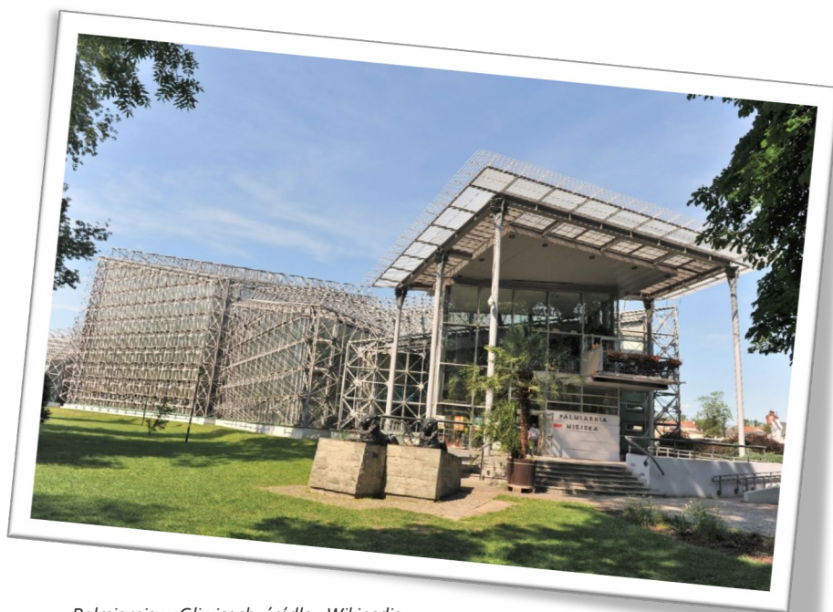
Palmiarnia w Gliwicach

rozwój obiektów rozpoczął się jednak w 1924 roku, kiedy to zorganizowano wielką wystawę roślin egzotycznych. Wśród nich prezentowano kolekcję palm. Trzy z nich