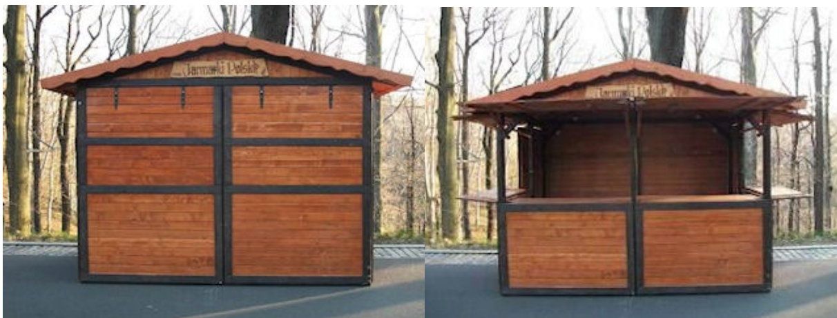
Poglądowa fotografia „Domku Drewnianego”.